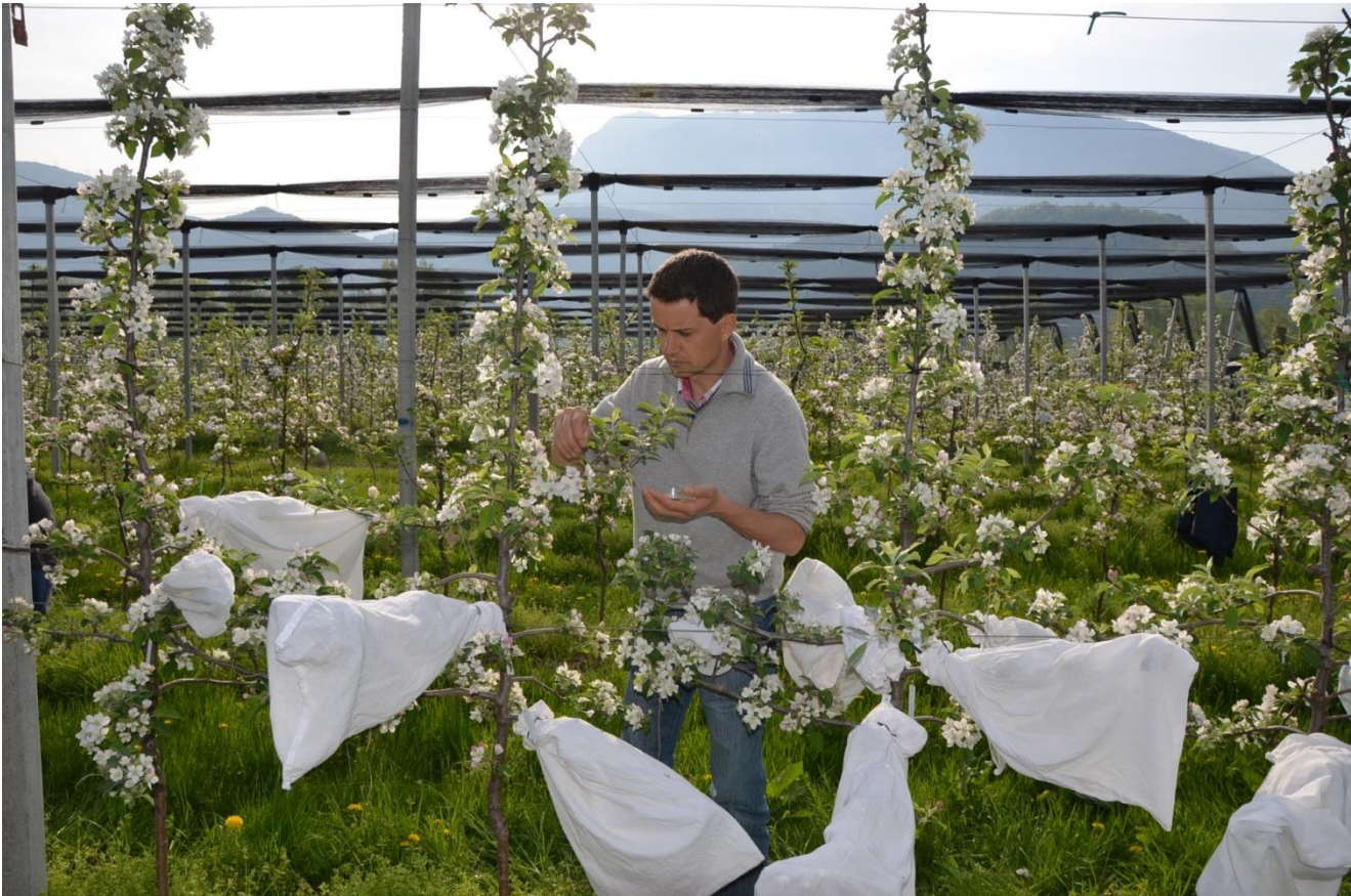
Abb. 1: Manuelle Bestäubung / Manual pollination.