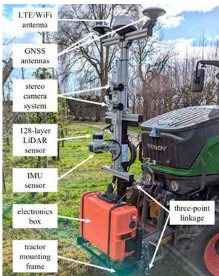
Sensorbox, nameščen na traktor