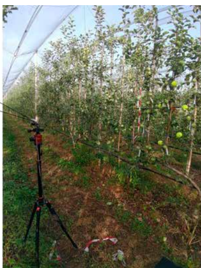
FieldRobotics rover v sadni steni (2D sadovnjak)