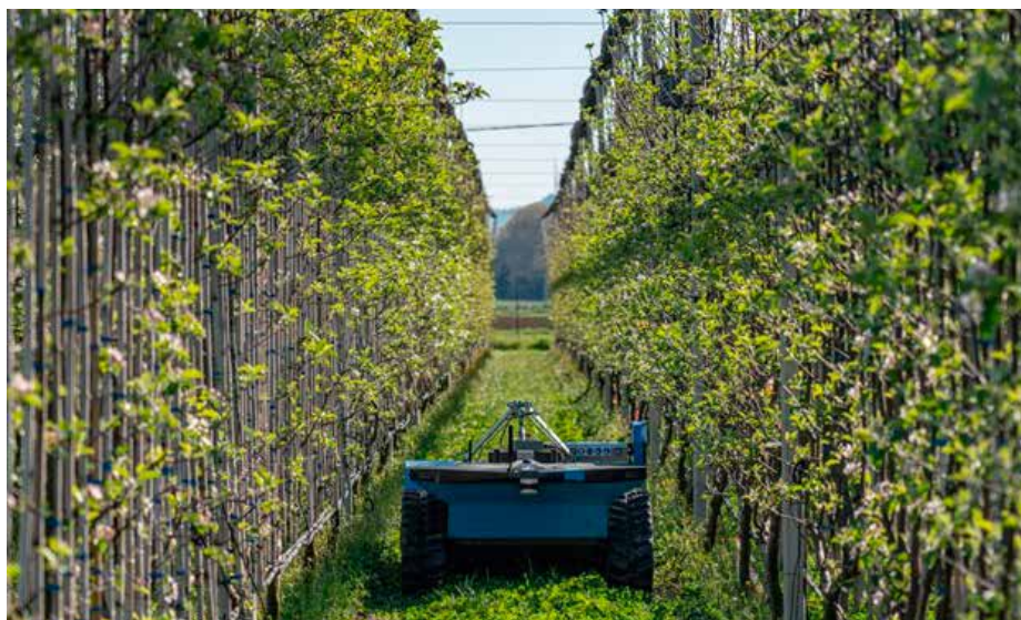
FieldRobotics rover v sadni steni (2D sadovnjak)

ki omogoča vizualizacijo podatkov na ravni sadovnjaka in posameznih dreves. Prvi prototip aplikacije je bil razvit v prvih dveh letih projekta in se od takrat nenehno izpopolnjuje. Trenutno se položaji posameznih dreves še vedno beležijo ročno z uporabo RTK merilnega droga (pripomoček, ki se uporablja za natančno določanje položaja s pomočjo satelitske navigacije). Poleg tega je bil razvit sistem na osnovi kamere, ki omogoča avtomatsko določanje položajev dreves glede na posnete slike. Tekom izvedbe projekta se bo ustrezna programska oprema za zaznavanje dograjevala in izboljševala. Algoritmi vizualne odometrije, ki temeljijo na samodejnemu učenju, rekonstruirajo okolje sadovnjakov, kar omogoča natančne slike, ki se uporabljajo za štetje in merjenje velikosti plodov. Natančnost zaznavanja plodov je bila ocenjena z nizom najsodobnejših algoritmov. Čeprav bi bil primernejši