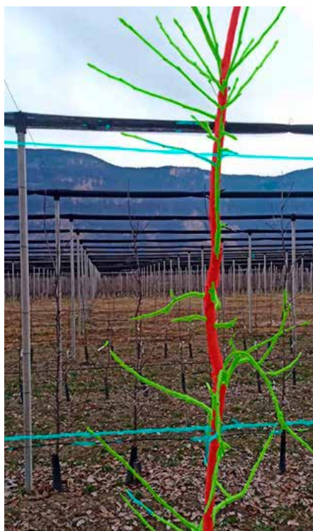
Prikaz slike v aplikaciji, ki se razvija v projektu AIpruning

Za pravilno rez dreves so potrebne izkušnje in natančno poznavanje značilnosti rasti. To lahko predstavlja težavo za lastnike trajnih nasadov, zlasti ob vse večjem pomanjkanju usposobljenih delavcev, ki bi znali pravilno rez izvajati. Pomanjkanje znanja delavcev pri rezi lahko privede do nepravilne rezi, ki lahko drevesu celo škodi. Pogosto so delavci tujci, pri čemer dodatno težavo povzroča nerazumevanja jezika, zaradi česar je otežena komunikacija. Tekom projekta je cilj reševanja te težave tak, da se delavce nauči pravilne rezi, ki jo kasneje opravljajo sami.