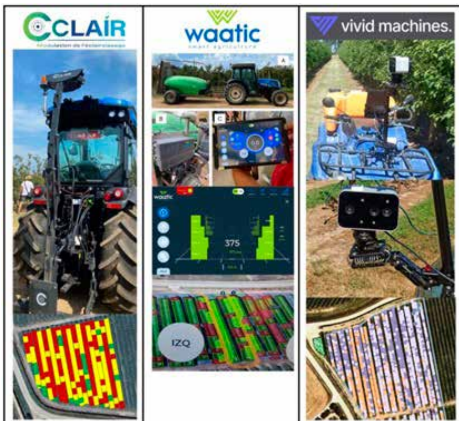
Prikaz programov različnih podjetij, ki jih preizkušajo v Španiji